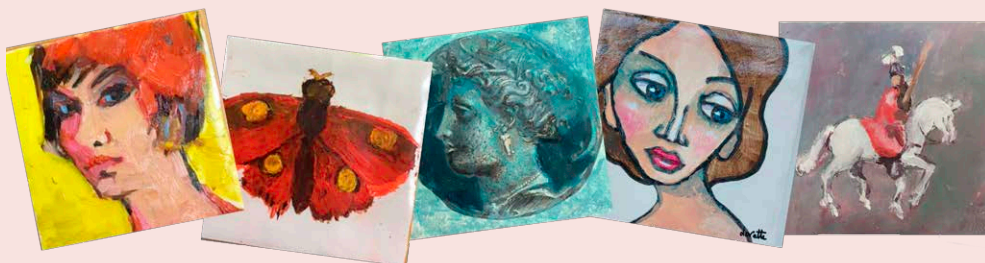
Een klein deel van de unieke kunstwerkjes

In juli waren de Kunstkring-kunstenaars actief op Woerdens Montmartre. Ze schilderden, tekenden en fotografeerden er mensen op het Kerkplein, maar ook landschapjes en kijkjes op Woerden zelf. Van de opbrengst van Montmartre schonk de Kunstkring Woerden een deel aan de nieuwe Mantelmeeuw!